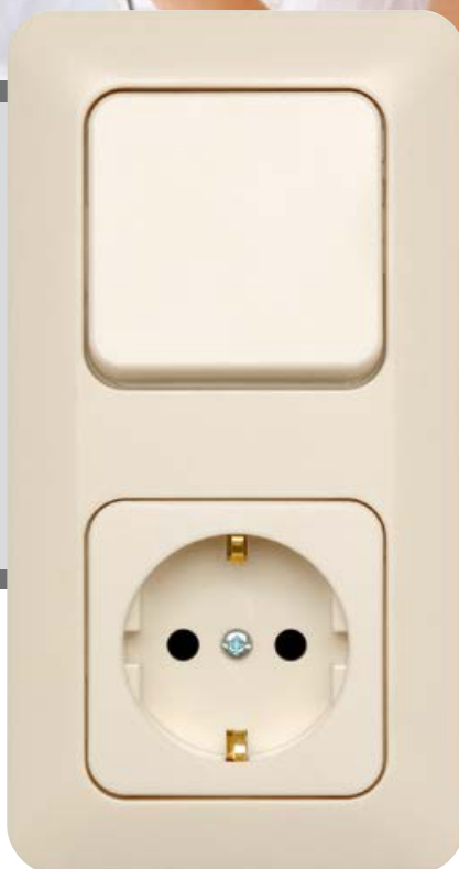
elektroweiß - RAL 1013 white