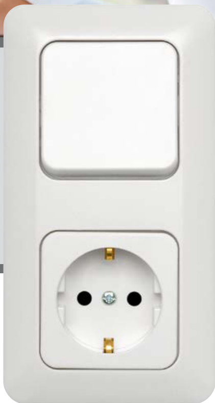
ultraweiß - RAL 9010 ultra white